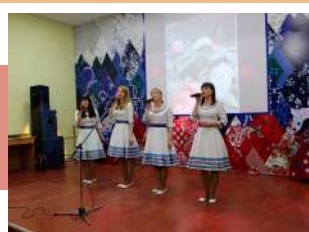
Выступление ансамбля «Лейся, песня!»