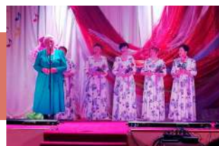
На сцене – ансамбль «Бабые лето»

25 лет на крыльях песни для ансамбля – это годы огромного труда и большого успеха.