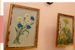
Букеты из пластилина