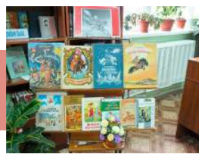
Выставка книг «Конек-Горбунок»

26 февраля в Новогуровском центре культуры, досуга и библиотечного обслуживания» состоялся литературный ринг «Вслед за Коньком-Горбунком», посвященный 205-летию со дня рождения П.П. Ершова, автора сказки в стихах. В интеллектуальном поединке сразились шестиклассники местной школы.