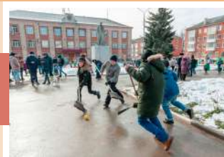
Хоккей с метлами

1 марта с большим размахом в городе Узловая состоялись проводы зимы.