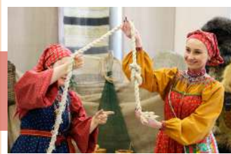
Презентация традиционных игр

21 февраля в выставочном зале Объединения центров состоялось открытие экспозиция «В движении северных рек». Культурно-интегративный проект «Человек играющий» продолжил свое развитие в своеобразном этнографическом путешествии, позволяющем окунуться в мир игрового традиционного фольклора, забав и игрушек различных областей России рубежа XIX–XX столетий.