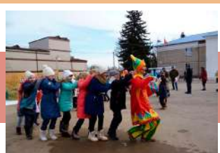
Веселый поезд со скomorохом

На всей территории Заокского района проводили зиму весело, ярко и интересно. 1 марта широкие гуляния развернулись на центральной площади п. Заокский, где внимание всех зрителей привлекал масленичный столб с подарками. В торговых рядах бесплатно угощали чаем, пловом и блинами. На протяжении нескольких часов жителей и гостей посёлка радовали песнями, частушками и танцами хореографический коллектив «Аллегро», народный хор «Русская песня» и приглашенные артисты.