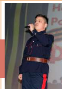
Звучит патриотическая песня