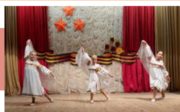
Выступление танцевального коллектива

21 февраля на братской могиле г. Советска Щекинского района прошел торжественный митинг, посвященный Дню защитника Отечества. Все присутствующие почтили память павших воинов во все времена минутой молчания. Торжественный митинг закончился возложением цветов и венков к братской могиле.