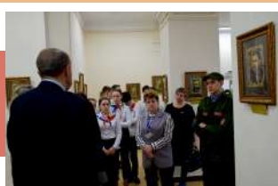
Экскурсия по экспозиции

Новая экспозиция представляет собой галерею портретов выдающихся разведчиков, внесших неоценимый вклад в дело обеспечения безопасности нашей страны. Здесь можно увидеть картины, изображающие узловчан – советскую разведчицу и детскую писательницу, лауреата Государственной премии СССР, полковника, Почетного гражданина Тульской области Зою Воскресенскую, начальника отделения научно-технической разведки, Героя Российской Федерации, полковника Леонида Квасникова, имеющих отношение к созданию атомного щита России, а также личные предметы знаменитых земляков.