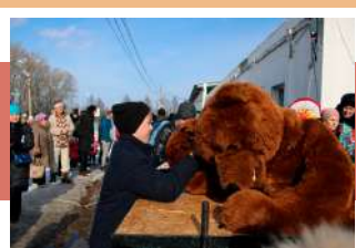
Армреслинг с Мишкой

Ясногорцев увлекли народные гуляния с песнями, плясками, хороводами и, конечно, блинами. Праздничное настроение подарили артисты Центра культуры и досуга и центра традиционной народной культуры «Родина».