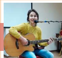
У микрофона автор