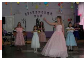
Мастер-класс по бальным танцам

Традиция проведения Сретенского бала корнями уходит в дореволюционную Россию, и сегодня она вновь возрождается в молодежной среде.