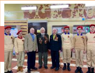
Фото с ветеранами