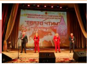
На сцене – ансамбль «Гремячанка»