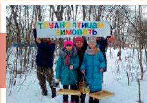
Трудно птицам зимовать

В рамках мероприятия школьники изготовили кормушки для птиц из разных материалов, подготовили экологические плакаты и листовки.