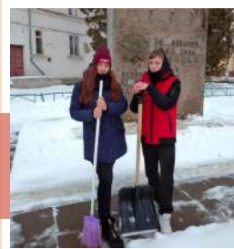
Участники акции «Мы помним»