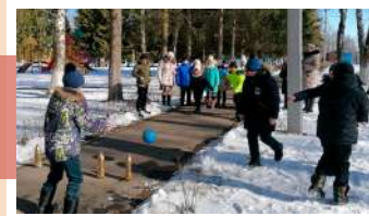
Конкурс «Самый меткий»

На свежем воздухе ребята соревновались в силе и ловкости, меткости и выносливости.