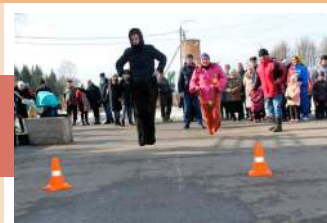
Бег в мешках

Отметили Масленицу и в п. Теплое. На площади Межпоселенческого ДК района здесь прошла концертно-развлекательная программа с театрализованным представлением «Ой, Маслена-красота! Открывайте ворота!».