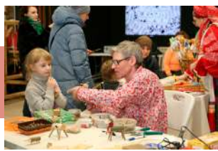
Мастер-класс «Бычок – смоляной бочок»

Взрослые и дети с удовольствием принимали участие в мастер-классах – ковали сердечки и подковы, чеканили монеты-доброейки, мастерили куклу-масленичку и деревянного бычка, писали письма гусиными перьями, украшали чеканкой браслеты и именные ложки, создавали обережные рамки и выжигали по дереву. Каждый мог изготовить масленку на гончарном круге, соткать коврик, расписать филимоновскую игрушку и смастерить фурчалку. Кипела жизнь и в wood-мастерской, где с увлечением осваивали плотницкие инструменты.