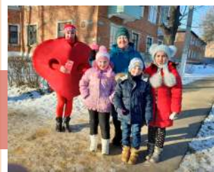
Сердце дарю людям

Под таким названием в МО Каменецкое прошла необычная акция, направленная на улучшение эмоционального состояния населения. Дети п. Каменецкий и п. Майский дарили жителям яркие сердечки с пожеланиями счастья, любви, здоровья, хорошего настроения, улыбок, везения и благополучия!