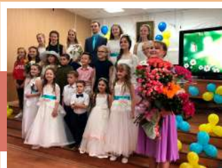
Участники детской студии