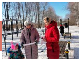
О правилах поведения в сети Интернет

11 февраля сотрудники Межпоселенческого Дома культуры провели тематическую акцию «Всемирный день безопасного Интернета». Основная цель мероприятия – обеспечение информационной безопасности несовершеннолетних путем привития им навыков ответственного и безопасного поведения в современной информационно-телекоммуникационной среде.