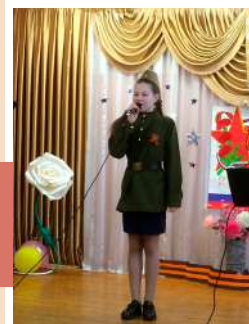
Защитникам Отечества посвящается

23 Февраля в Правдинском сельском Доме культуры Новомосковского района состоялась концертная программа «Мужество, Доблесть и Честь!». Она открылась песней «Защитники Отечества» в исполнении участников вокального коллектива «Сударушка». Трогательные песни про папу подарили зрителям юные вокалисты из кружков «Искорки» и «Улыбка» и творческие коллективы Прохоровского сельского Дома культуры.