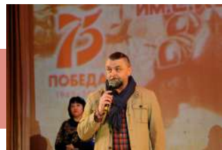
Слово председателя жюри

Зрители очень тепло принимали выступающих, подпевали, услышав знакомые строчки «Темной ночи», «Майского вальса», «Журавлей». У старшего поколения, чье детство пришлось на сороковые-роковые, песни «Мой милый, если б не было войны», «Баллада о матери», «Ты же выжил, солдат», «Снег седины», «Нежность» пробуждали воспоминания, вызывали слезы.