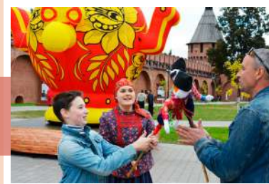
Герои театра Петрушки

В течение дня на ярмарочной площади развернулись балаганные представления, явления народного театра Петрушки и театра передвижных картинок «Тульский раек», работали анимационные площадки со старинными играми и забавами, в которых с удовольствием участвовали взрослые и дети.