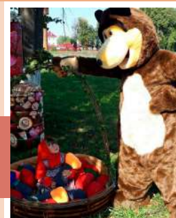
На фотозоне «Маша и Медведь»

Так называлась тематическая развлекательно-познавательная программа, которая 2 сентября прошла для детей в Доме культуры п. Теплое. В этот день для них работали игровые и познавательные площадки, фотозоны, мастер-классы.