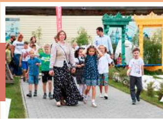
Прогулка по улице Резной

2 сентября более 80 школьников Тулы начали новый учебный год со знакомства с народными традициями и промыслами родного края на ремесленном дворе «Добродей». Так, на Кузнечной слободе они совершили путешествие в историю кузнечного дела в городе оружейников, увидели, как работает кузнец, и приняли участие в мастер-классе по холодной обработке металла, отчеканив на память монетку «Копейку-добродейку».