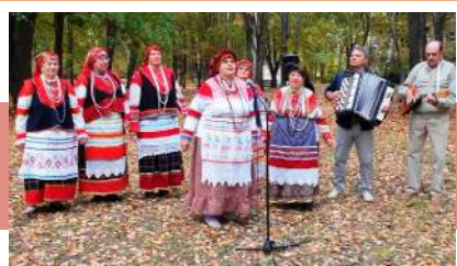
Частушки от души