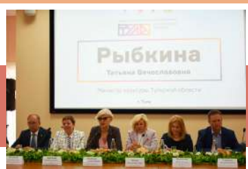
Президиум круглого стола

В ходе деловой программы обсуждались вопросы, связанные с поддержкой организаций и мастеров народных художественных промыслов, анализом новых законодательных инициатив, рассмотрением народных художественных промыслов и ремесел в качестве инструмента развития внутреннего и въездного туризма, тенденции традиционной культуры в современном восприятии.