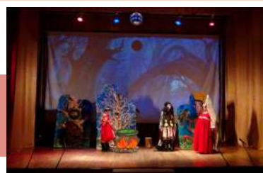
Вовка у Бабы-яги