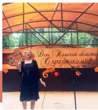
Звучат песни о Туле