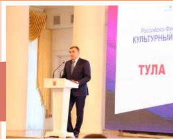
Приветствие губернатора Алексея Дюмина

27 и 28 сентября в Туле прошел XX Российско-Финляндский культурный форум, посвященный 75-летию установления добрососедских отношений между Россией и Финляндией.