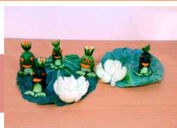
Забавные существа из овощей

Оказывается, что овощи и фрукты – это не только весьма полезные продукты, которые содержат витамины, минералы и другие необходимые вещества, но и замечательный материал для творчества. Посмотрите, какие забавные существа получились из даров осени.