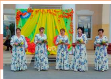
Выступление ансамбля «Бабье лето»

Так назывался концерт, который состоялся 8 сентября на площади Новогуровского центра культуры, досуга и библиотечного обслуживания.