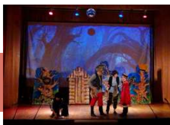
Встреча с разбойниками

Зрители увидели историю веселого мальчишки, который не любит учить уроки, а любит лишь читать сказки. И вот Вовка идет в библиотеку, где начинается фантастическая история. Взяв по совету библиотекаря книгу с волшебными сказками, он перемещается в Тридевятое царство, где проходит различные испытания. В этом мире преодолевать препятствия Вовке помогают любимые герои.