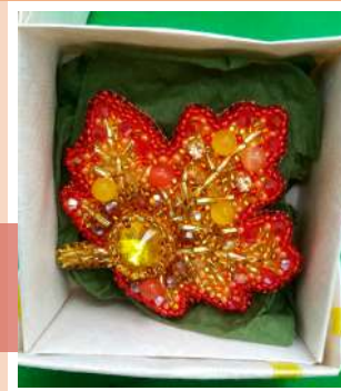
Экспонат выставки ДПИ

Традиционно в этот день на территории парка разместились узловские подворья: фермеры и мастера ремесел продемонстрировали свои достижения. Для гостей работали интерактивные площадки, мастер-классы, выставки изделий декоративно-прикладного творчества.