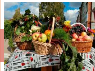
Выставка «Дары осени»

21 сентября на площадке Культурно-досугового центра г. Новомосковска прошел фестиваль здорового семейного досуга «Фруктово-овощной уикенд». Программа включала выставку кружка декоративно-прикладного искусства по пошиву мягкой игрушки «Эврика», мастер-класс для детей по изготовлению игольницы «Яблоко», работу игровых и развлекательных площадок, чемпионат по скоростному поеданию арбуза, выступление творческих коллективов и, конечно, дегустацию различных блюд.