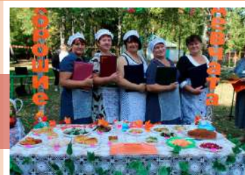
Площадка «Хорошие девочки»

Работники культуры Михайловского сельского филиала представили интерактивную театрализованную зону «Хорошие девочки». Руководитель кружка декоратив-