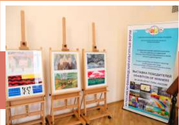
Выставка детского рисунка

Программа включала церемонию торжественного открытия, пленарные заседания, тематические семинары-секции «Музыка, танец, театр», «Визуальное искусство и ремесло», «Библиотечное дело, литература и образование», «Культурные мероприятия и фестивали», «Дети и молодежь», совещание рабочих групп, двусторонние переговоры, работу «Проектного кафе», презентацию г. Лаhti, где будет проведен XXI Российско-Финляндский культурный форум.