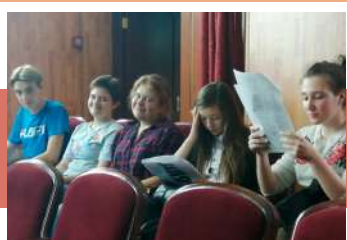
Работа с текстом роли

Так называлось мероприятие в Молодежном театре г. Узловая, в ходе которого актеры предоставили возможность зрителям стать участниками репетиционного процесса, увидеть спектакль на начальном этапе создания.