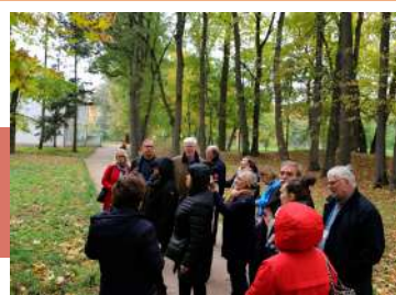
Посещение музея-усадьбы «Ясная Поляна»

Вечером в Тульской областной филармонии состоялось заключительное пленарное заседание. Участники мероприятия посмотрели концертную версию этномюзикла «Сказание о деве-тулянке и Засечной черте» в исполнении фольклорного ансамбля «Улада» и хореографического коллектива «Визави».