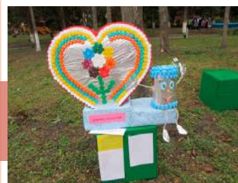
Арт-объект на Острове умельцев