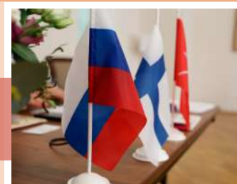
Флаги России и Финляндии

XX Российско-Финляндский культурный форум стал значимым событием в жизни Тулы. Министерство культуры РФ характеризует город как перспективную площадку для проведения подобных мероприятий. 27 и 28 сентября она объединила единомышленников в деле сохранения, развития и популяризации культуры обеих стран.