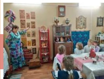
Знакомство с крестьянским бытом