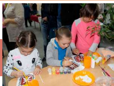
В творческой мастерской

14 сентября на базе Межпоселенческого Дома культуры Тепло-Огаревского района состоялось праздничное мероприятие «Родная земля». Для гостей в этот день работали выставка-продажа национальных блюд «Кулинарная мозаика», мастер-классы «Творческая мастерская».