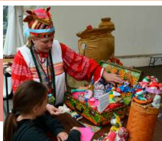
Удивительные вещи из бабушкиного сундучка

Гости праздника не только увидели, но и приобрели уникальные авторские работы народных умельцев из разных уголков России, а также Республики Беларусь.