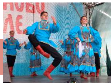
Народные танцы от «Красивомечья»