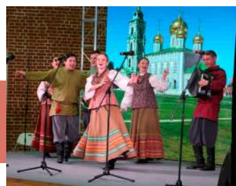
Выступление в атриуме Тульского кремля

зодчества Тульский кремль, Тульскую набережную и Музейный квартал, побывали в музее «Тульские самовары», Тульском музее изобразительных искусств и музее оружия.