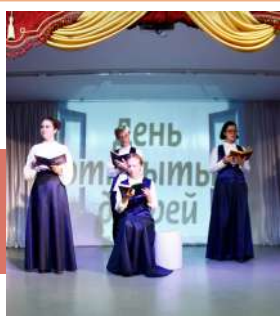
Презентация творческих коллективов

11 сентября в Культурно-досуговом центре Новомосковска открылся 30-й творческий сезон. Для зрителей была подготовлена большая презентационная программа о клубных формированиях.