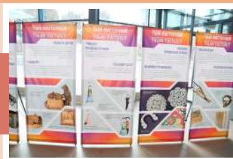
Выставка «Тула мастеровая»

В первый день работы форума наши российские и зарубежные коллеги посетили выставку детского рисунка ДШИ «Канцона» г. Ярославля по итогам VI открытого конкурса «Листая страницу за страницей. Города и села России и Финляндии в прозе, поэзии и драматургии» и посмотрели выступление детских и молодежных фольклорных коллективов в Дворянском собрании и познакомились с работами тульских современных ремесленников на выставке «Тула мастеровая» в Атриуме.