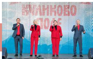
На сцене – «Гремячанка»

Зрителей покорили яркие выступления народных ансамблей танца «Варенька» и «Хорошее настроение», народного ансамбля русской песни «Тулский хоровод», заслуженного вокального ансамбля «Субботея», ансамбля гармонистов «Озорные переборы» и хореографического ансамбля «Ассоль» из Тулы.