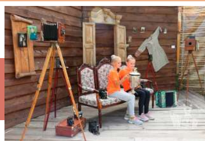
В интерьере фотозоны