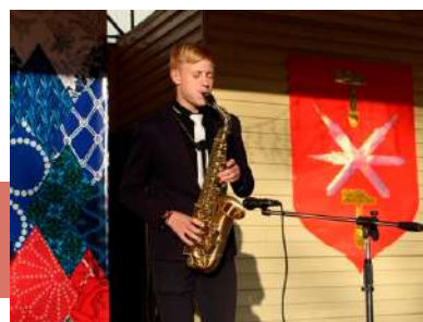
Соло на саксофоне