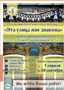
Конкурс «Эта улица мне знакома»

Работы на конкурс принимаются с 1 апреля по 20 сентября 2019 года по e-mail: iks.ock@tularegion.org или по адресу: г. Тула, ул. 9 Мая, д. 1 «а», каб. № 5,