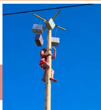
Вперед, к заветной цели!

На празднике каждый мог найти развлечение по душе: пока детвора прыгала на батутах и соревновалась во всевозможных эстафетах, взрослые наслаждались весенней погодой и всевозможными угощениями, главным из которых стали, конечно же, блины.