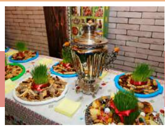
Проросшая пшеница – символ Навруза

Праздничное веселье переместилось в ремесленный двор «Добродей», где посетителей мероприятия ожидал обряд очищения огнем. Прыгая через костер, участники мероприятия символически очистились от грехов.