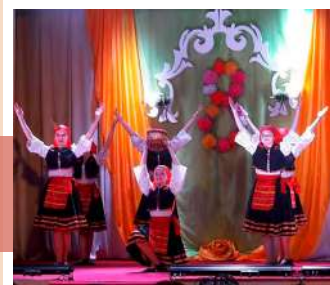
Участники концерта в Новогуровском ЦКДиБО

и счастья земле, по которой идете Вы – Женщины! Ведь и сама Земля вращается только потому, что шагаете по ней Вы – самая прекрасная половина человечества».