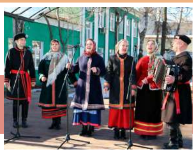
Выступление ансамбля «Спасская слобода»

Волшебный напиток зарядил особой энергией почетный знак «Добродей», вручение которого ознаменовало кульминацию торжественной части мероприятия. Его получили те, кто сделал значительный вклад в развитие народного творчества и сохранение традиций тульской земли.