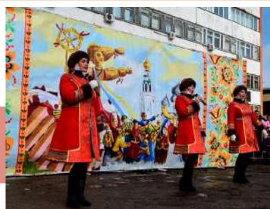
Выступление вокальной группы «Малина»

ди пыхтел пузатый самовар, и каждый желающий мог согреться вкусным и ароматным чаем на травах с сушками и конфетами, отведать блинчиков. Для детворы работали аттракционы «Меткий глаз», «Катание на пони», торговые площадки с игрушками, попкорном и сладкой ватой. Закончилась Масленица дружным хороводом и традиционным сжиганием чучела зимы.