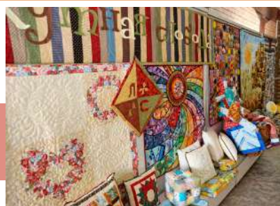
Мир Лоскутной слободы

Днем на сцене стартовали семейные конкурсы, победители которых получали заряд позитивного настроения и множество подарков. Взрослые демонстрировали свою силу и удаль в метании валенка, перетягивании каната, поднятии гири и т.д. И, конечно, масленичные гуляния не могли обойтись без традиционных забав – сжигания чучела и покорения масленичного столба.