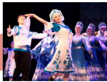
Участники концертной программы