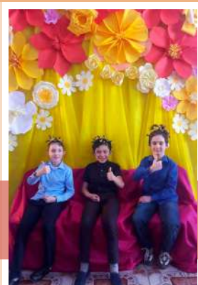
Участники веселых конкурсов

6 марта в Новогуровском центре культуры, досуга и библиотечного обслуживания для младших школьников состоялось праздничное мероприятие, посвященное Международному женскому дню. Мальчики подготовили для девочек весеннюю песню и именные каштунки, в которой каждая юная леди могла узнать себя.