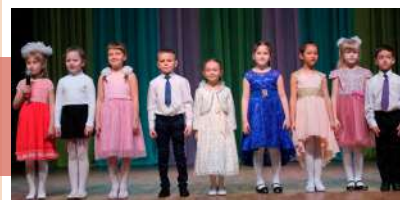
Поздравление юных участников концерта

Необычный подарок преподнесли сотрудники киреевского телевидения. Специально для праздника был смонтирован юмористический фильм с участием первых лиц нашего района. Сюжет заключался в том, что, бросив свои важные рабочие дела, руководители администрации, больницы, инспектор по пожарному надзору поспешили на праздник, чтобы поздравить работников культуры. Сюрприз получился «на ура»!