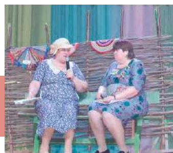
Все самое интересное – на завалинке

Выступление Подосинковского СДК было оформлено в виде кукольного театра с главными героями Дедом, Бабой и Внучкой. Они собрались на концерт в Дом культуры, где Внучка стала ведущей программы, в которую вошли номера художественной самодельности.