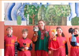
Юные актеры с героями спектакля

В костюмах Петрушки шутками и прибаутками они развесели весь зал. А затем показали кукольную сказку о том, как неугомонный котёнок Васька, провозгласив себя царём зверей, запугал обитателей леса: лису, волка, медведя и ворону. В конце «рыжего львёнка» разоблачили, но никто не остался обиженным. Победила дружба.