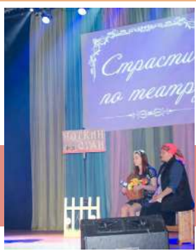
На полустанке «Ноткин стан»

Дедиловский СДК представил театрализованную программу, главными героями в которой стали 2 уборщицы, между которыми происходили юмористические монологи, сопровождавшиеся выступлением коллективов художественной самодельности. По режиссёрскому замыслу постановка должна показать, что каждый человек в жизни, к какой бы профессии он ни принадлежал, желает видеть себя хоть раз на подмостках сцены.