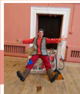
В гостях у Емели

В Арсеньевском центре культуры, досуга и кино на масленичной неделе прошел квест «Весёлая Масленица» для учащихся начальных классов. В зале с экспозицией «Убранство русской избы» их встретили герои мероприятия – Хозяюшка, Емеля, Домовой и Скоморох.