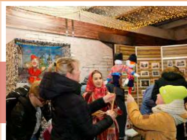
Герои раёшного представления

Отметить Масленицу в тульских традициях с балаганскими представлениями и играми пришло много людей. Каждому нашлось занятие по душе. Всех увлек масленичный квест. Взрослые и дети метали метлы и бросали кольца, разгадывали загадки, пробегали под солнечными воротами, срывая платочки на удачу, играли в деревянный крокет.