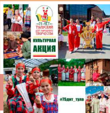
Культурная акция #75ДНТ_Тула

В 2019-м ГУК ТО «ОЦРИНКиТ» отмечает 75-летие Тульского Дома народного творчества, правопреемником которого является. С марта стартовала акция «75 лет ДНТ». Суть ее проста. Юбилей – наш, а подарки – вам! Поддержите акцию в соцсетях и получите ценные призы. Посещайте наши выставки и интерактивные программы, двор «Добродей», мастер-классы, приходите на «Тульскую вечерку», фестивали «Тульский заиграй», «Молодо-зелено», «Бежин луг», «День пряника», «Страна в миниатюре», «Двенадцать ключей» и другие, выкладывайте свои архивные фото с мероприятий прошлых лет с хэштегом #75днт_тула.