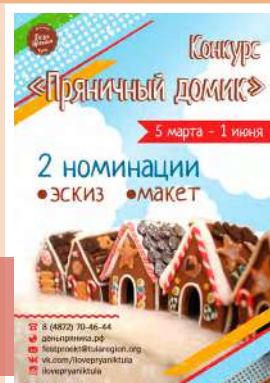
Конкурс «Пряничный домик»

Мы ждем ваши работы. Успейте зарядиться пряничным настроением и наполнить праздник новыми впечатлениями. Жюри по достоинству оценит ваши художественные способности, оригинальность и нестандартные решения. Лучшие эскизы и макеты украсят выставку на фестивале «День пряника».