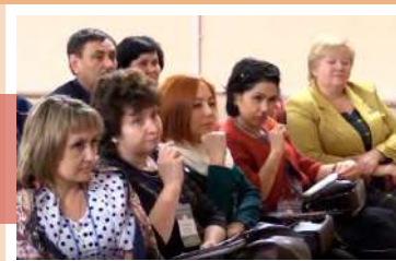
Обсуждение насущных вопросов

В этот же день наших коллег ожидало знакомство с Приупским сельским Домом культуры Киреевского района, учреждением нового формата, выступающего как многофункциональный центр. Здесь, под одной крышей, работают отделение Липковской музыкальной школы, подростково-молодежный центр, поселковый ДК и библиотека.