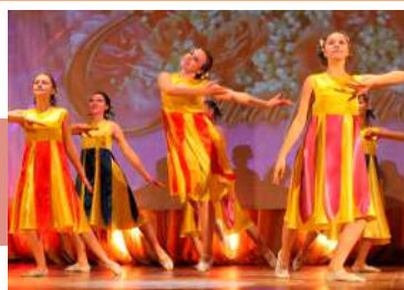
Танец – украшение праздника

Так назывался концерт, который прошел накануне 8 Марта в Арсеньевском центре культуры, досуга и кино. Множество ярких и красочных номеров было подготовлено в подарок арсеньевским женщинам. Зрительный зал в этот вечер еле вместил посетителей, желающих посмотреть концертную программу и принять поздравления.