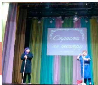
Ничто человеческое не чуждо

Главные персонажи Приупского СДК – Дед и Баба, которые включили прямой эфир телепередачи по «Телемолве» Районного смотра художественной самодельности, но потом решили поехать в город, чтобы смотреть его не по телевизору, а наяву, в РДК. Но, приехав в город, старики решили посетить магазин модной одежды (театрализованная миниатюра «В бутике») и затем нарядными отправиться в Дом культуры. Режиссёрский замысел состоял в том, что в любом возрасте люди интересуются театром и искусством.