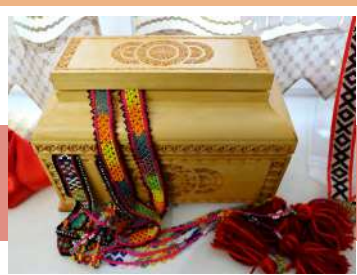
Украшения из бисера

Так называется выставка-мотив, которая открылась Объединении центров 4 марта. Посетителей встречают подлинные этнографические костюмы, дополненные украшениями из бисера, изготовленными современными мастерицами по старинным образцам. По стенам развешаны расшитые полотенца и салфетки, старинные рушники и занавески, коврики и декоративные панно.