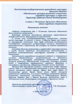
Слово к юбилею

«Сердечно поздравляем вас с 75-летием тульского областного Дома народного творчества.