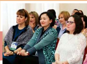
Делегация из Башкортостана

С 9 по 12 марта в Тульской области прошел семинар-практикум для директоров муниципальных дворцов культуры и руководителей клубных систем Республики Башкортостан «Реализация социокультурных проектов и проектов в области культуры и культурно-познавательного туризма». Организатором мероприятия, которое включало проектные сессии, круглые столы, разнообразные экскурсионные программы, посещение перспективных сельских домов культуры и культурно-образовательных центров, выступило Объединение центров.