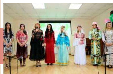
Участницы конкурса «Мисс Навруз»

Ярким концертным номером стало выступление ансамбля узбекских трубачей «Бахор». Традиционные мотивы на карнае и сурнае заворожили зрительный зал, погрузив в атмосферу древней Бухары.