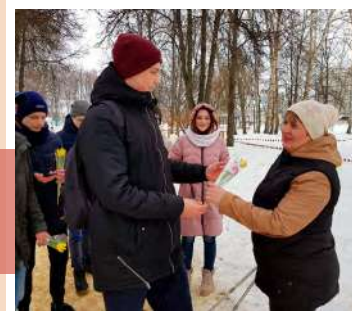
Тюльпаны – символ праздника

8 Марта волонтеры молодежного движения «МКР» Куркинского РДК (рук. А.Г. Лаухина) поддержали Всероссийскую акцию «Вам любимые!».