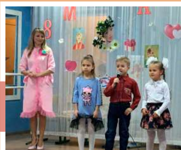
Поздравление от самых юных

Так называлось праздничное мероприятие в Центре творческого развития и гуманитарного образования г. Суворова. 8 Марта – замечательный день, согретый лучами солнца, женскими улыбками и украшенный россыпью цветов.