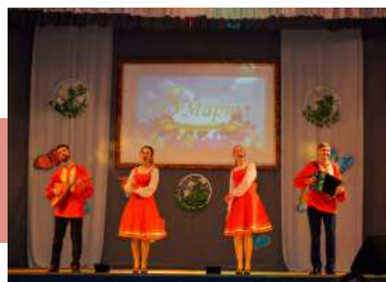
Музыкальный букет пожеланий

И, конечно, со сцены в этот день не раз звучали поздравления для милых женщин. «Букет пожеланий» вызвал много улыбок и оставил приятные впечатления.