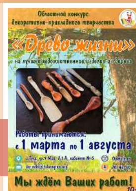
Конкурс «Дерево жизни»

Заявки и работы принимаются до 1 августа по адресу: 300028, г. Тула, ул. 9 Мая, д. 1-а, каб. № 5; контактный телефон: 8 (4872) 70-43-55.