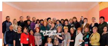
На память о семинаре

12 марта наши гости побывали в музее купеческого быта в п. Епифань, посетили Центр культурного развития «Верховье Дона», став участниками интерактивной программы «Проводы казака в армию». Вторая половина дня прошла в Приупском сельском Доме культуры Киреевского района, обновленном по программам «Местный Дом культуры» и «Сто клубов на селе».