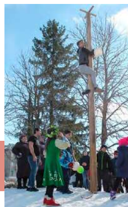
Покорение масленичного столба

Желающие могли посоревноваться в перетягивании каната и показать свою силу, распилить бревно двуручной пилой, продемонстрировать смекалку и удаль в штурме столба. Взрослые и дети водили хороводы, пели частушки и танцевали, просили прощения, участвовали в веселых конкурсах.