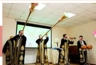
На сцене узбекские трубачи

Композиция «Широка страна моя родная» ансамбля танца «Притяжение» вызвала восторженные аплодисменты публики.