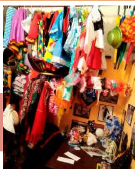
Поиски в гримерке

Команды разгадывали ключевые слова, собирали детали костюма главного героя, отгадывали загадки про персонажей кукольного театра и сами изготавливали их. Ребята блестяще справились с заданием, смастерив отгаданных героев – Мальвину и Арлекино.