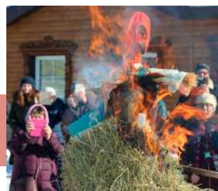
Сжигание чучела Масленицы

На Плотницкой слободе гости постигли тайные смыслы деревянных узоров, заглянув в музейно-выставочный комплекс «Тульский резной наличник». И, конечно же, все угощались блинами и ароматным травяным чаем из жарового самовара.