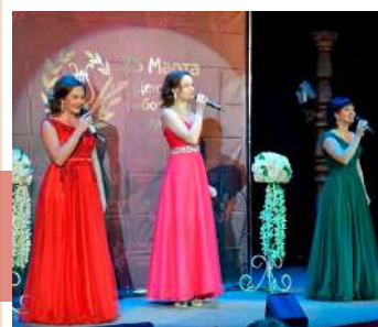
Выступление солистов ГДК «Ровесник»