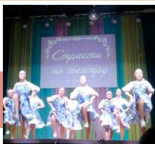
Танцевальный коллектив Приупского СДК

ческих сцен, своеобразным творческим соревнованием самодельных коллективов, которое завершилось идеей, что в театре все направления хороши. Представление закончилось объединяющей песней.