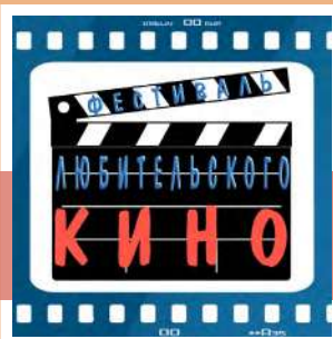
Фестиваль любительского кино

С 1 апреля по 22 июня в Объединении центров пройдет IV региональный фестиваль любительского кино. К участию в нем приглашаются любительские коллективы, киновидеостудии и индивидуальные авторы.