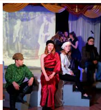
Новый проект – меланж-акт «Живой звук»

24 марта на сцене КДЦ г. Новомосковска в исполнении народного молодежного театра-студии «Арлекин» прозвучал музыкальный меланж-акт «Живой звук». Основой постановки стали известные композиции из фильмов, спектаклей, мюзиклов и даже рок-оперы прошлого столетия.