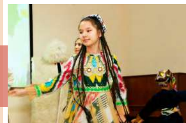
Фрагмент «Андижанской польки»

мянского танцевального коллектива «Аракс», хореографического ансамбля «Варенька» с композицией «Калинка», хореографического ансамбля «Веселая компания» с русской барыней и инструментального коллектива «МИКСТ» с озорными наигрышами на деревянных ложках.