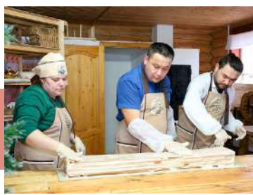
Азы изготовления белевской пастилы

Вторую половину дня делегация провела в Ясной Поляне и Тульском кремле. Наши гости посетили музей-усадьбу Л.Н. Толстого, проявили интерес к тульским брендам и традициям.