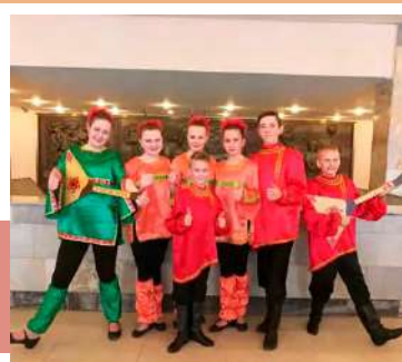
Народный ансамбль танца «Калинка»

Поздравляем с победой народный ансамбль танца «Калинка», который стал обладателем диплома 1 степени на Международном конкурсе-фестивале творческих коллективов «Наследие времен», состоявшемся 3 марта в Москве.