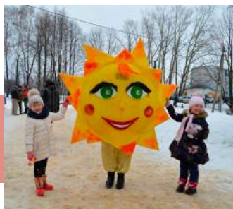
Солнышко на память

В Прощеное воскресенье гуляли и в п. Куркино. В парке культуры и отдыха с размахом прошло народное гулянье «Душа ль ты моя, Масленица». Под веселую музыку ведущие собрали достаточно большое количество жителей от мала до велика. Звучало множество песен, прибауток, приговоров, частушек, посвященных празднику. Выступающих поддерживали плясками и танцами.