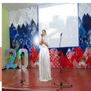
Песня о родной земле