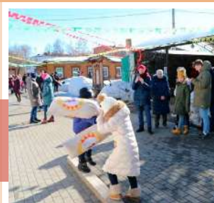
Бой на мешках