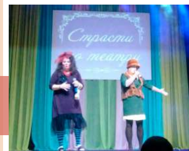
Как же мне прославиться?

В основе сценария – взаимоотношения женской команды корабля и молодого капитана. Пройдя через ряд испытаний-ситуаций, они понимают, что все – это одна семья, каждый член которой одинаково дорог.