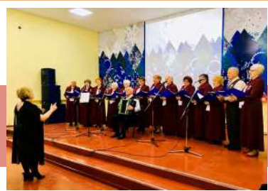
На сцене – хор ветеранов