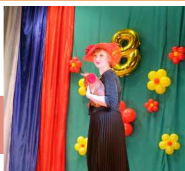
Участница «Шляпного бала»