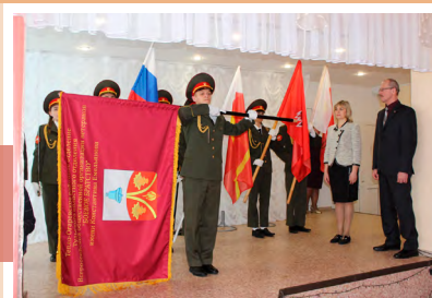
Церемония передачи знамени

тий, подготовленное работниками Межпоселенческого Дома культуры Тепло-Огаревского района совместно с комитетом образования МО Тепло-Огаревский район.