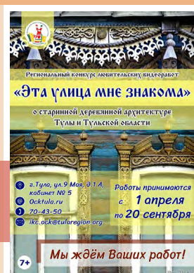
Конкурс «Эта улица мне знакома»

бот о старинной деревянной архитектуре Тулы и Тульской области, участие в котором могут принять все желающие. Он проводится по двум номинациям: «Где время застыло на стрелках часов» и «Вторая жизнь».