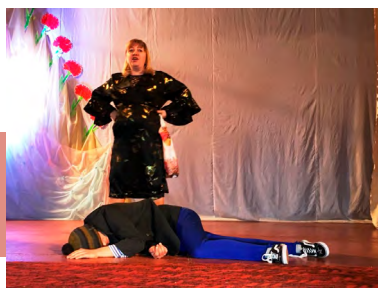
Фрагмент театральной сценки