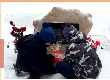
Акция «Красный тюльпан Памяти»

17 февраля в Новогуровском центре культуры юные волонтеры из клуба по интересам «Доброе сердце» приняли участие в акции «Красный тюльпан Памяти».