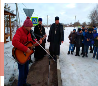
Исполнение патриотических песен

16 февраля на родине святой блаженной Матроны, в селе Себино, состоялся традиционный праздник – День православной молодежи. В мероприятии приняли участие работники Центра культурного развития «Верховье Дона» п. Епифань Кимовского района, которые подготовили и провели развлекательную программу, состоявшую из русских народных игр.