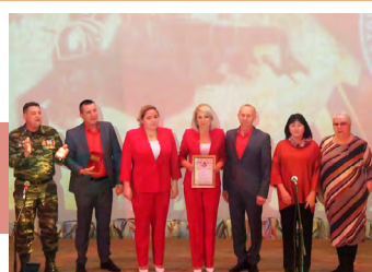
Ансамбль «Гремячанка» (в центре) с членами жюри

Приятно отметить, что уровень исполнительского мастерства и сценической культуры участников конкурса растет год от года, и членам областного жюри все сложнее выбирать лучшего из лучших. Все представляли свои номера ярко, эмоционально, образно, используя элементы театрализации.