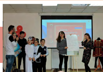
Прикольно слышать, как твоё имя звучит по-армянски

Программа праздника включала мастер-класс по каллиграфии и дефиле народного костюма. Каждый мог написать свое имя армянскими буквами и услышать, как звучит его имя на армянском языке.