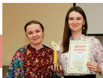
Лауреаты I степени

1 февраля 2019 года в Объединении центров развития искусства, народной культуры и туризма состоялась церемония награждения победителей IV Открытого областного фольклорного фестиваля-конкурса «Зимние святки», в котором приняли участие 10 детских школ искусств Тульской области. В ходе отбора победило 37 человек. Все они награждены дипломами, а лауреатам 1 степени вручены также памятные подарки.