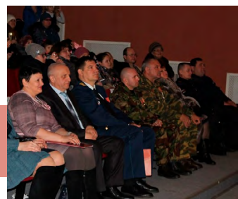
В зрительном зале – аншлаг