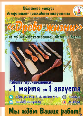
Конкурс «Древо жизни»

По результатам конкурса будет организована выставка лучших работ.