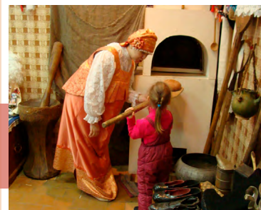
Достаем хлеб из печки

Под таким названием с 4 по 8 февраля в Центре народной культуры и ремесла г. Богородицка прошли интерактивные занятия для школьников. Ребятам встретили Василиса Премудрая и Домовую. Они рассказали о том, какую роль играла печь в повседневной жизни людей в прежние времена.