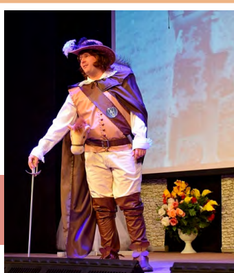
Один из мушкетеров

В преддверии праздника «Дня защитника Отечества» 22 февраля в Доме театра и кино «Юность» состоялось феерическое шоу «Мужчина года – 2019», подготовленное талантливыми сотрудниками ГДК «Ровесник». Зрителям выпала уникальная возможность присутствовать на генеральной репетиции мюзикла «Новый Д'Артаньян» по мотивам произведения Александра Дюма «Три мушкетера».