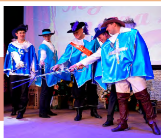
Участники конкурса «Новый Д'Артаньян»