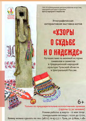
Выставка «Узоры о судьбе и о надежде»

и занавески с цветочным орнаментом, подушки и коврики. На выставке покажут, как плели коврики из лоскутков, научат завязывать разными способами тканые пояса и дадут возможность поработать на швейной машинке «Зингер», которой более ста лет.