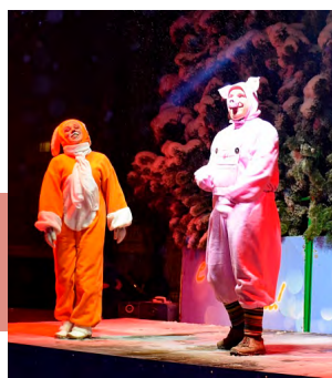
Герои театрализованного представления

Мероприятие продолжилось яркой театрализованной постановкой для детей и взрослых. Дети с удовольствием наблюдали за происходящим на сцене, участвовали в играх и повторяли движения за сказочными персонажами. Вместе с узловчанами Дед Мороз и Снегурочка под яркие залпы фейерверка зажгли огоньки на новогодней красавице-елке. После представления Дед Мороз раздал детишкам сладкие подарки.