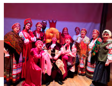
Актеры театрализованного концерта

Дети и взрослые водили хороводы, развлекались в зимних забавах и народных играх, веселились от души. Все активные участники праздника получили от сказочных героев сладкие подарки и отличное настроение.