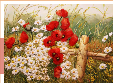
Картина «Лето в деревне»