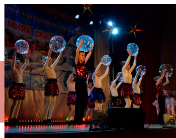
Выступление танцевального коллектива «Феерия»

Артистизм, сценическая культура, техника исполнения, раскрытие художественного образа, оригинальность и новизна, композиционно-музыкальное решение – такими критериями оценивалось мастерство участников ежегодного Районного хореографического фестиваля «Зимняя сказка» в городе Узловая. В 2018 году в конкурсе приняли участие более 40 творческих коллективов, не только Узловского района, но и из других районов Тульской области.