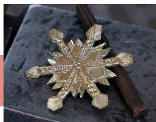
Символ новогодней столицы России

14 декабря в ГУК ТО «ОЦРИНКИТ» открылась новогодняя резиденция Левши. В торжественном открытии приняла участие министр культуры Тульской области Татьяна Рыбкина, которая подчеркнула, что здесь, на одной из площадок новогодней столицы России, можно познакомиться с исконными тульскими ремеслами, увидеть многое из того, чем дорожит город мастеров. Татьяна Вячеславовна как почетный гость забила первый гвоздь в скрижаль истории «Добродея».