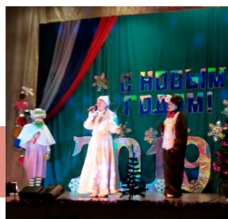
Встречаем символ 2019 года

25 декабря работники Передвижного Центра культуры и досуга г. Кимовска показали для малышей новогоднее театрализованное представление «Символ наступающего года».