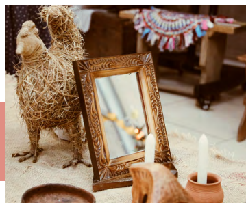
Атрибуты святочных гаданий