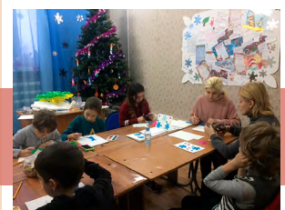
Изготовление новогодних открыток

С 3 по 27 декабря 2018 года в Киреевском РДК впервые работала новогодняя резиденция Деда Мороза. Мальчишки и девчонки с нетерпением ждали появления главного зимнего волшебника, писали ему письма, играли с ним, танцевали, пели, читали стихи. Каждый день здесь был наполнен творчеством.