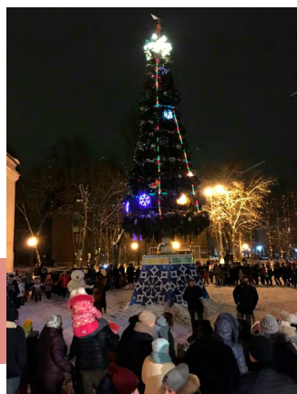
Открытие городской елки

27 декабря в Киреевске состоялось открытие городской елки. Праздник стартовал с поздравлений ведущих с наступающим Новым годом. Зимушка-зима и Снегурочка пожелали всем крепкого здоровья, счастья, удачи и любви, а затем началась концертная программа, в которой соединились «Танец снежинок» и «Конфетный танец», конкурс новогодних открыток на елку, популярные новогодние хиты и пляски, новогодние приключения и конкурсы.