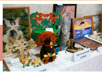
Выставка декоративно-прикладного творчества

Участниками заключительного этапа фестиваля стали 130 лауреатов в возрасте от 3 до 18 лет, занявшие призовые места в различных жанрах самодеятельного художественного творчества.