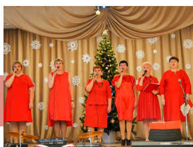
Участники концерта в Красноярском ДК

22 декабря после ремонта вновь распахнули двери два сельских дома культуры – в поселках Приупском и Красный Яр, филиалы Киреевского РДК. Это стало большим событием для жителей тульской глубинки. Вдохнуть жизнь в старые стены, модернизировать материальную базу помог проект единокороссов «Местный Дом культуры».