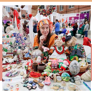
Разнообразные сувениры ручной работы