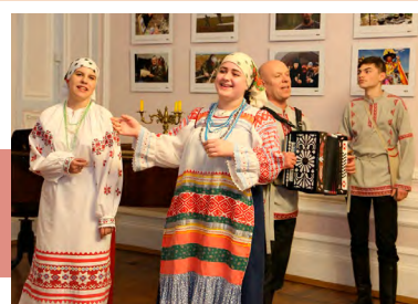
Выступление «Спасской слободы»