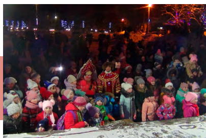
Фрагмент новогодней программы

Довольные ребята вместе с мамами и бабушками кружились в хороводе вокруг ёлки, отгадывали загадки, играли в шуточные игры, принимали участие в эстафетах, устраивали заводной флешмоб, делились друг с другом хорошим настроением и, конечно, пели и танцевали. Не отставала от них и Снегурочка, предлагая все новые и новые развлечения.