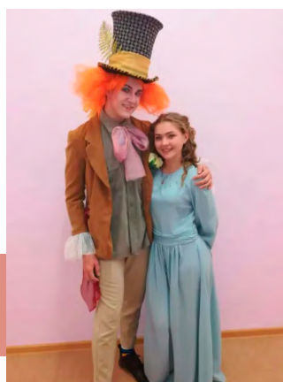
Шляпник и Алиса

Торжественное открытие Приупского СДК стало настоящим праздником для населения поселка. В обновленный ДК они вошли под разудалую «Барыню», где в фойе развернулась выставка изделий местного кружка декоративно-прикладного творчества. Любому желающему мог сфотографироваться на фоне новогодней елки с забавным снеговиком.