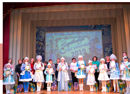
Такие разные Снегурочки

16 декабря в ДК «Сахарник» п. Товарковского Богородицкого района состоялся традиционный межрайонный конкурс «Снегурочка-2019». В этом году он был посвящен 145-летию знаменитой сказки и 195-летию со дня рождения ее создателя, драматурга А.Н. Островского. Программа включала визитную карточку, вокальные и хореографические состязания, викторины и мастер-шоу, игры и забавы. В конкурсе приняли участие Снегурочки из п. Товарковского, Бахметьево и Жданка, с. Иевлево и Новопокровка Богородицкого района, г. Богородицка и п. Бородинского Киреевского района. Они порадовали зрителя своим обаянием, артистизмом и находчивостью.