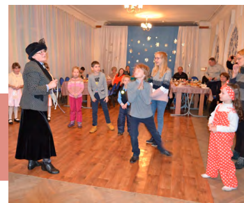
Веселые игры со старухой Шапокляк