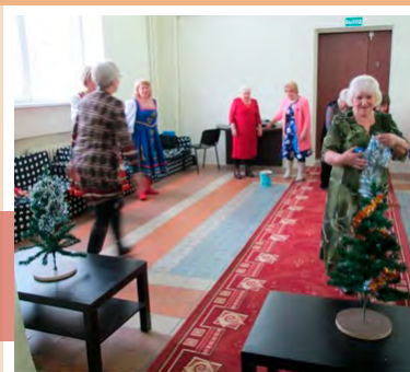
Конкурс «Наряди ёлочку»

Гости праздника с удовольствием участвовали в конкурсах «Рыбалка», «Наряди ёлочку», отвечали на вопросы зимней викторины, водили хороводы, слушали песни в исполнении народного коллектива «Лейся, песня!» и исполняли новогодние частушки под баян.