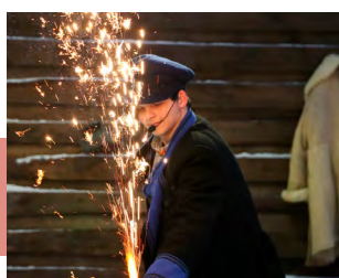
Открытие новогодней резиденции Левши

13 декабря в ГУК ТО «ОЦРИНКИТ» стартовали новогодние киноутренники. Дед Мороз и Снегурочка поздравили зрителей с наступающим Новым годом, провели интересные игры и загадали загадки. А затем дети получили видеоподарок, с удовольствием посмотрев мультфильм «Чудо-Юдо».