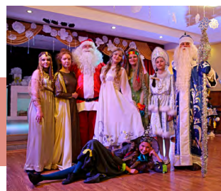
Актеры новогоднего спектакля