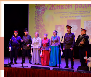
Выступление ансамбля «Благовест»