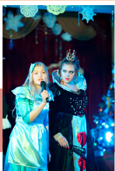
Вперед, за приключениями!

21, 22 и 23 декабря в Культурно-досуговом центре г. Новомосковска с успехом прошло новогоднее представление «Алиса в Стране чудес». Зрители совершили увлекательное путешествие, полное приключений и превращений. Фокусы и театр теней, веселые конкурсы и подарки, любимые персонажи – яркие картинки детских утренников.