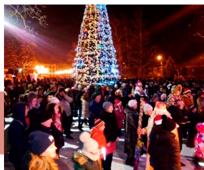
Новогодняя ночь в Кимовске