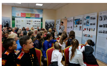
Экскурсия по выставке

Особый интерес вызвала экспозиция «Известные немцы Тульской области». Ведущие фестиваля рассказали, как связаны с нашим краем такие знаменитые на весь мир личности, как граф Алексей Бобринский, друг Пушкина Антон Дельвиг, учёный-изобретатель Константин Аммон.