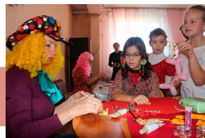
Мастер-класс «Подковы счастья»

20 октября в Культурно-досуговом центре г. Новомосковска прошел веселый и зажигательный день «Отдыхаем всей семьей». В этот день зрителей ожидала масса сюрпризов: мастер-класс по изготовлению собачки из воздушного шарика-колбаски, мастер-класс по изготовлению «Подковы счастья» в технике джутовая филигрань, встреча с неутомимым клоуном Булюлюкой, семейные игры и конкурсы, танцы и многое другое.