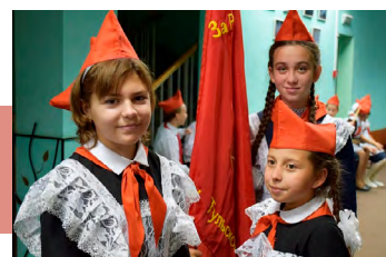
Молодая смена XXI века – пионеры школы № 2