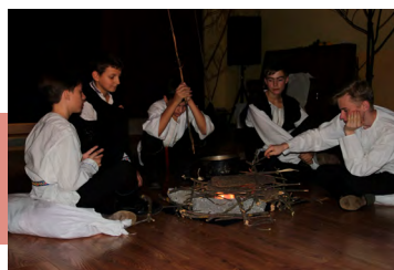
Сцена «Мальчики в ночном»

Постановочный план репетиции включал в себя четыре разноплановых произведения И. Тургенева. Зрители смогли насладиться композицией «Стихотворения в прозе», инсценировкой рассказа «Бежин луг» из цикла «Записки охотника», художественной хроникой «Человек в серых очках». Постдраматический театр и театр литературный были представлены произведением «Дым».