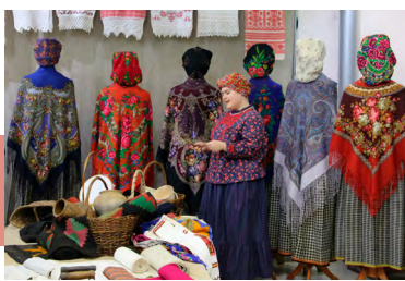
Рассказ о женском рукоделии

В Объединении центров развития искусства, народной культуры и туризма вот уже более месяца работает выставка «Полотно–Покров–Платок», на которой представлен традиционный текстиль конца XIX–середины XX века в обрядовой, праздничной культуре и повседневной жизни русских людей.