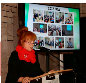
Презентация Школы клубного работника

В рамках Дня открытых дверей состоялась конференция «Кооперация учреждений культуры. Формирование комплексного турпродукта как способ взаимного продвижения. Проблемы и перспективы». Также прошло награждение представителей СМИ, активно сотрудничающих в сфере популяризации народной культуры. Благодарственные письма вручены также победителям областного смотра-конкурса среди передвижных учреждений культуры клубного типа на лучшую работу с детьми и молодежью по противодействию наркотикам.