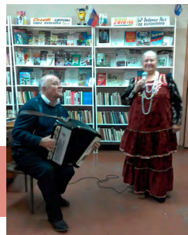
Задорные частушки под баян

Праздничный вечер «Люди пожилые – сердцем молодые» также прошел и в клубе микрорайона Зубовский г. Кимовска, собравший активных представителей старшего поколения, постоянных участников мероприятий.