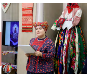
Экскурс в прошлое

В основе проекта – около 150 экспонатов из фондов краеведческих музеев Ясногорска, Волова, Узловой, Крапивны и частных коллекций. Среди них – традиционный свадебный костюм Белёвского уезда, расшитая золотыми нитями косынка из Пскова «Золотая головка», павловопосадские и барановские платки, шелковая шаль из Торжка, полотенца и вышитые рушники, дмотканое льняное полотно.