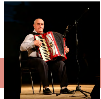
Соло на аккордеоне

Участниками гала-концерта VII областного фестиваля творчества пожилых людей стали 247 человек из 16 муниципальных образований области – лауреаты и дипломанты в шести номинациях фестиваля, победители отборочных туров.