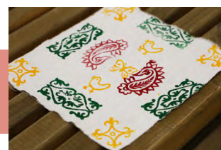
Салфетка с узорами

С помощью мультимедийных средств на выставке демонстрируется процесс изготовления полотна в русской деревне, а мастер-шоу приглашает примерить платки, узнать о «фирменных» стилях повязывания, бытовавших в разных уездах Тульской губернии, научиться традиционным и современным способам ношения платка.