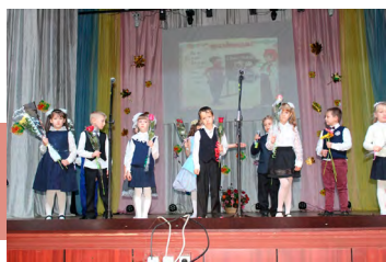
Участники концертной программы