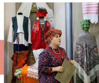
На выставке «Полотно-Покров- Платок»

Гости ознакомились с работой «Областной школы традиционных ремесленных технологий», «Областной школы русского фольклора», «Областной школы клубного работника» и «Театральной мастерской» Центра народного творчества. Для педагогов, студентов и школьников были презентованы специальные программы: проект #Учительвакдре и фестиваль-квест «Общий сбор» по городам Тульской заочной черты. Работники культуры, туляки и гости города по достоинству оценили ярмарку мастер-классов гончарного ремесла, лепки и росписи филимоновской игрушки, ткачества, изготовления традиционных текстильных кукол, по верховой набойке на ткани и с удовольствием поучаствовали в мастер-классах по кузнечному ремеслу.