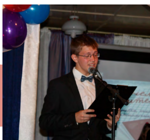
Слова благодарности от воспитанников

Дети исполняли песни и танцы, читали стихи, разыгрывали интересные сценки. Концертные номера были пронизаны добротой и любовью, талантом и юмором. Каждое выступление школьников сопровождалось бурными аплодисментами! Концерт прошел в теплой атмосфере и подарил всем учителям, ветеранам педагогического труда много позитива и хорошего настроения.