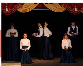
Сцена из композиции «Стихотворения в прозе»