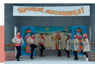
Концерт в парке ДК «Гипсовый»