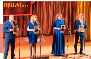
Поют солисты «Гремячанки»

По итогам подсчета баллов определились победители в разных номинациях. Обладателем Гран-при конкурса стало вокальное трио «Господа-товарищи» (пос. Ленинский). Их выступление запомнилось зрителю проникновенным исполнением песни «Ясный сокол» и торжественным пожеланием «Многая лета русской земле». Среди вокальных ансамблей лауреатом I степени признан народный ансамбль народной песни «Субботея» (пос. Иншинский) с хитами «Златая Русь» и «Русь называют святою», лауреатом II степени стал вокальный ансамбль «Россиянка» (ТУМГ п. Пришня), исполнивший песни «За тихой рекою» и «Бывший подьесаул», лауреатом III степени – вокальная эстрадная группа «Летний вечер» (г. Новомосковск), представившая на суд жюри сложную композицию «Если бы перекрестила ты меня во след» и агитационную песню нового времени «Вперед, Россия!».