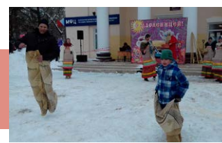
Бег в мешках

Чтобы развеять тоску царевны, объявлялись различные конкурсы, забавы и состязания: перетягивание каната, поедание блинов, состязание силачей с гириями и бег в мешках. Смельчаки покоряли масленичный столб, демонстрировали молодецкую удаль и силу. Все веселились от души. На площади работали аттракционы, продавались сувениры и сладости. Каждый мог отведать шашлычка да блинчика, вкусного и чайку ароматного, приготовленного в самоваре на дровах.