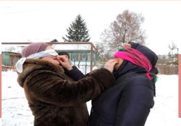
Конкурс «Накорми блином соседа»

В сквере «Центральный» кимовчане собрались на последний хоровод зимы. Программа праздника включала площадку «Масленичные забавы», выставку декоративно-прикладного творчества, концерт, дегустацию традиционных масленичных блюд. Все пели, плясали, играли, водили хороводы и лакомились блинами. Проводили зиму традиционным русским обрядом – сжиганием чучела Масленицы.