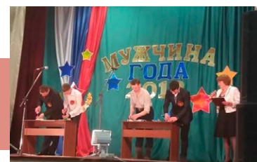
Мастера на все руки

Они представили себя и свою профессию в визитной карточке «Я рад знакомству с вами», проявили смекалку и находчивость в блиц-опросе по военной тематике, презентовали исторический костюм богатырей, изготовленный со своей группой поддержки, поразили умением справляться с домашними делами (пришивали пуговицу, вкручивали саморез, мастерили поделку из детского конструктора), блеснули актерским мастерством в конкурсе пародий на звезд эстрады и шоу-бизнеса. В зале не смолкали аплодисменты болельщиков.