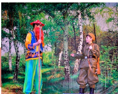
Встреча с лесовичком

В ефремовском РДК «Химик» состоялась премьера спектакля «Солдат Иван Тарабанов», подготовленного подростковым составом народного театра «Сувенир». По сюжету Иван Тарабанов едет на побывку домой. По дороге он встречает старичка-лесовичка, который рассказывает солдату, что к царской дочке повадился приходить бесенок, отчего царю нет спокойной жизни. Иван Тарабанов отправляется во дворец выручать царя.