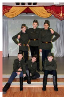
Артисты театра-студии «Арлекин»

День защитника Отечества никогда не устареет, и в этот праздник, по традиции, чествуют сильных духом мужчин, ветеранов войн, возлагают цветы к мемориалам, вспоминают героические страницы русской истории. Далее читайте, какие мероприятия состоялись в рамках этой даты в культурно-досуговых учреждениях Тульской области.