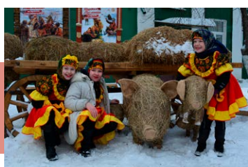
Участницы «Оникса» на «Добром подворье»

Популярностью пользовались интерактивные программы в музейно-выставочном комплексе «Тульский резной наличник». Дети и взрослые декорировали фоторамку, изготавливали обереги и участвовали в украшении резного скворечника.