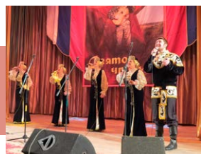
На сцене – ансамбль «Субботея»

Жюри предстояла нелегкая задача, настолько яркими, эмоциональными, необычными были концертные номера. Все участники показали высокий профессиональный уровень, интересный репертуар, раскрыли образы содержания песен.