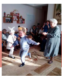
Творческий подарок к празднику

Твардовского «Василий Теркин», поучаствовали в состязаниях по перетягиванию каната и сделали праздничную открытку.