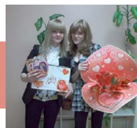
Такие разные валентинки

ник – самый сердечный день календаря, время для любовных признаний и добрых слов. Из разрозненных деталей зрители складывали одно большое сердце.