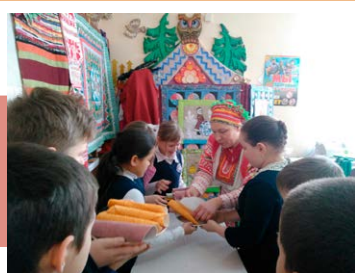
В творческой мастерской

С обрядами Масленицы начали знакомиться накануне праздника. Так, 8 февраля в Киреевском РДК прошла фольклорная познавательная программа для младших школьников «Масленичные обрядовые печенья». Дети узнали о традициях, приняли участие в забавах и конкурсах.