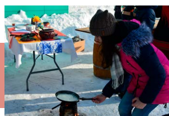
На площадке «Пенёк-блинопёк»

Масленица – один из самых древних и интересных праздников народного календаря. Это веселые проводы зимы, радостное ожидание близкого тепла и весеннего обновления природы. Длится Масленица неделю, каждый день которой имеет свое название, обычаи и ритуалы. Праздник отмечается красиво и с размахом, с особенным колоритом и щедрым угощением. Недаром говорится: «Как Масленицу встретишь – так и год проведешь!» Далее читайте, как отпраздновали проводы русской зимы на тульской земле.