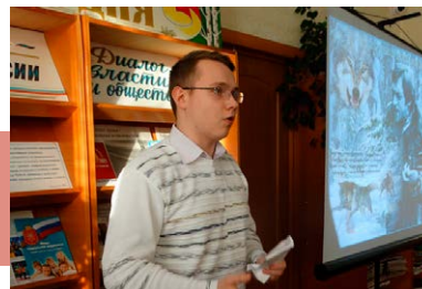
Звучат стихи В.С. Высоцкого

В читальном зале межпоселенческой центральной районной библиотеки г. Кимовска прошел юбилейный вечер «Голос правды и добра». Много было сказано о поэте, перипетиях его нелегкой судьбы, всенародной любви. Зрители посмотрели кадры из фильмов и спектаклей с участием Высоцкого, послушали стихи и песни в авторском исполнении, откровения его друзей и современников.