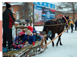
Катание на санях