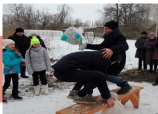
Бой на мешках

В д. Львово Кимовского района 17 февраля прошли масленичные гуляния, которые подготовили и провели работники автоклуба № 2 МКУК «ПЦКиД». Перед зрителями выступил народный фольклорный коллектив «Рябинушка», который исполнил фольклорные масленичные песни и частушки.