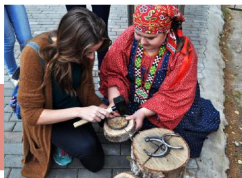
Приобщение к народным играм

На игровой площадке «Кузнечики» дети знакомились с традиционными русскими забавами, упражнялись в знании кузнечных пословиц и поговорок. На память о празднике каждый мог отчеканить монету с логотипом «Тульской кузни».