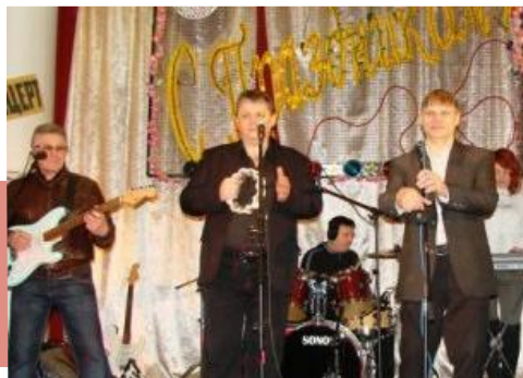
Выступление ВИА «Янтарь», г. Узловая