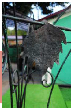
Арт-объект мастер-шоу «Тульское стальное кружево»