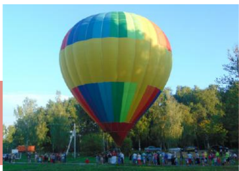
Полет на воздушном шаре

С 18:00 до 20:00 на площадке «Газпром – детям» ажиотаж вызвал незабываемый, захватывающий дух подъем на воздушном шаре. Все хотели посмотреть на свой родной поселок с высоты птичьего полета.