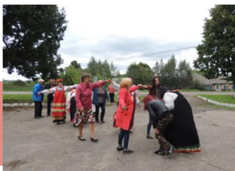
Народные забавы на деревенских посиделках

Жители села активно поддерживали выступление «Рябинушки», водили хороводы, плясали «Кадриль», пели частушки, играли в русские народные игры – горелки, ручеек, колечко. Праздник всем понравился, и не хотелось расставаться. Жители села Хитровщина выразили коллективу благодарность и пожелание, чтобы такие встречи проводились чаще.