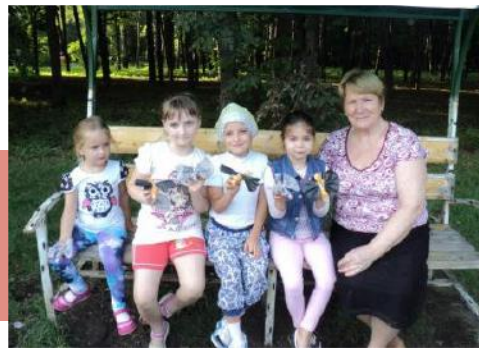
Мастер-классы в Плавске

Парк Плавска стал центром городской жизни, местом отдыха для всего населения города. Здесь проходят городские праздники, летом его аллеи заполнены любителями отдохнуть на свежем воздухе, рано утром и вечером спортсмены всех возрастов совершают разминки и пробежки. Специализированные детские площадки, велодром и поляна сказок ежедневно наполняются шумом детских голосов.