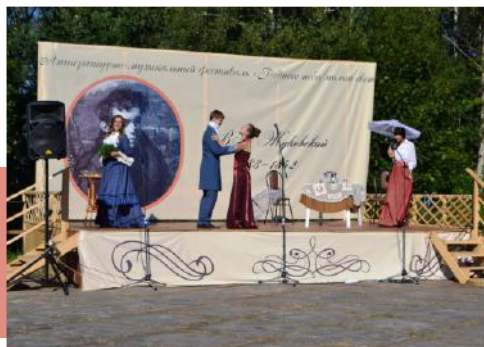
Театрализованная программа фестиваля