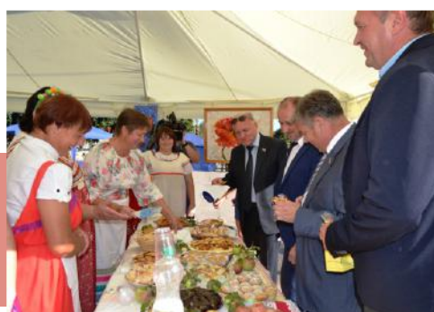
Яблочное угощение для почетных гостей

На празднике все нашли занятия по душе: взрослые «зажигали» перед сценой, дети развлекались на интерактивных игровых площадках. В рамках фестиваля была развернута выставка декоративно-прикладного искусства мастеров МБУК «БЦРКТ» и др. регионов, работали мастер-классы, организованы ярмарка яблок и яблочной продукции, дегустация пастилы разных производителей.