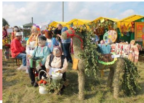
Выставка изделий декоративно-прикладного творчества

развернута яркая ярмарка традиционных народных ремесел, проходили мастер-классы по декоративно-прикладному творчеству. Умельцы предлагали познакомиться и с оберегами, и с украшениями: удивительные сплетенные из трав и веток фигурки, тканное из веток полотно, лоскутные коврики и картины, душистые венки. На подворье «Деделовская окрошка с хреном» можно было продегустировать блюда народной кулинарии Киреевского района.