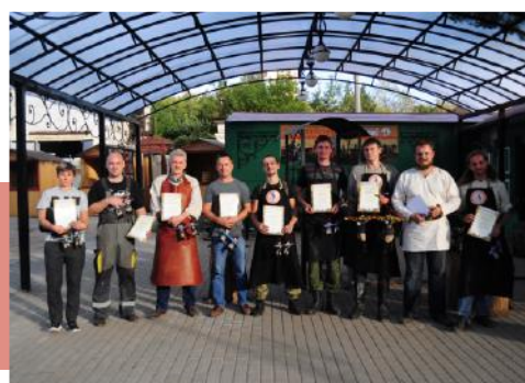
Итоговое фото участников праздника с дипломами и подарками

За творческое сотрудничество кузнецы получили дипломы и тульские сувениры в виде тряпичных кукол Кузьмы и Демьяна, покровителей кузнечного дела и семейного очага.