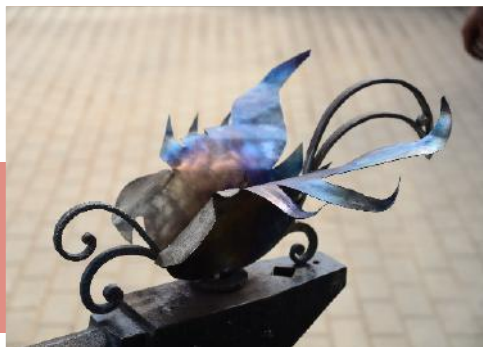
Жар-птица, рожденная из пламени горна

В этот день зрители стали свидетелями мастер-шоу «Кузнец семейного счастья». Они наблюдали, как из пламени горна рождается удивительная, сверкающая всеми красками на осеннем солнце жар-птица и как мастера сражаются в профессиональном конкурсе «Подкова на счастье».