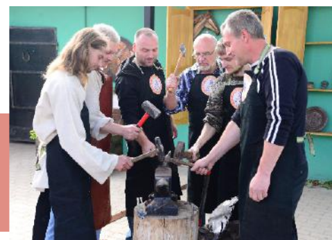
Совместный удар молотов по наковальне возвестил о начале праздника

2 сентября, на торжественном открытии праздника, звучало много слов благодарности тульским кузнецам, возрождающим и популяризирующим это старинное ремесло, выражалась надежда, что на подворье «Тульская кузня» будут проходить не только замечательные шоу и мастер-классы, но и творческие поединки, обмен опытом, кузнечное дело будет передаваться последующим поколениям. Напутствие мастерам дал и основатель кузнечного дела в России Никита Демидов, чтоб задел наперед был и в «Тульской кузне» ремесло в умелых руках всегда продолжалось.