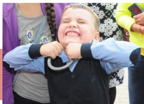
А гнутся ли подковы тульских кузнецов?

Мастер-шоу «Белое каление» наглядно показывает, как прочное вещество становится податливым, послушным для дальнейшего преобразования. На глазах изумленной ребятни металл подвергают всяческим «пыткам»: проковывают, растягивают, плющат, утончают, загибают в причудливые завитки. И вот готов вензель. Его опускают в ведро с холодной водой. После купания металл становится твердым и необычайно крепким – закаленным!