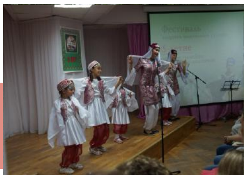
Вокальный коллектив «Звездочки» поют песни по-татарски и по-русски

народа, стремящихся развивать национальную культуру. По инициативе и при непосредственном участии председателя автономии Фазола Канифулловича Насибуллинна в городе регулярно проводятся музыкально-литературные вечера, посвящённые выдающимся деятелям татарского народа, национальные праздники. На фестивале звучали стихи и песни на русском и татарском языках, исполнялись зажигательные танцы, а в завершении программы всех пригласили на традиционное татарское чаепитие.