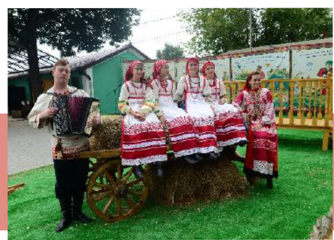
Участники фольклорного ансамбля «Околица»

«Копоть в кузнице останется, а народу чудо явится», – гласит народная пословица. И действительно, в эти шесть дней на подворье «Тульская кузня» творилось настоящее волшебство: проводился профессиональный конкурс «Подкова на счастье», из пламени кузнечного горна появлялась огненная жар-птица, металл нагревался до белого каления и рассыпался искрами в воздухе, чудесные вещи, выкованные руками мастеров, украсили кузнечное дерево подворья. Желающих поучаствовать в мастер-классах было великое множество. А это значит, что кузнечное ремесло будет развиваться.