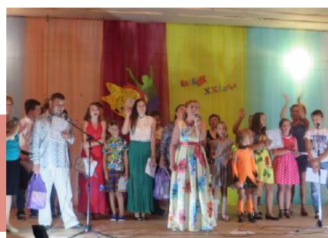
Участники смотра-конкурса «КЛУБ' ок XXI века»