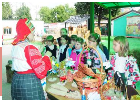
Мастер-класс по тряпичной кукле

из Новомосковска (руководитель А.В. Мельников). Они не только порадовали зрителей песнями, но и воодушевляли мастеров в творческих поединках, водили хороводы с детьми.