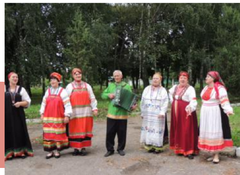
Участники фольклорного ансамбля «Рябинушка»

Жители села активно поддерживали выступление «Рябинушки», водили хороводы, плясали «Кадриль», пели частушки, играли в русские народные игры – горелки, ручеек, колечко. Праздник всем понравился, и не хотелось расставаться. Жители села Хитровщина выразили коллективу благодарность и пожелание, чтобы такие встречи проводились чаще.