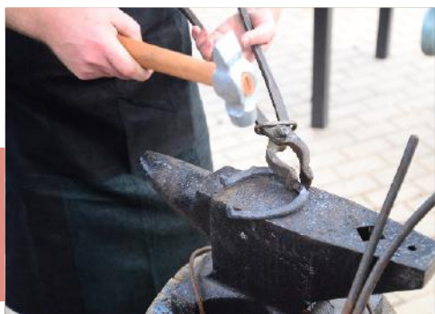
Перекрученная подкова Коптева-младшего

Все мастера, участники праздника «Кузнечная седмица», получили памятные дипломы и сладкий тульский символ. Но самое главное, что тульские кузнецы смогли показать, чем владеют, как они умеют