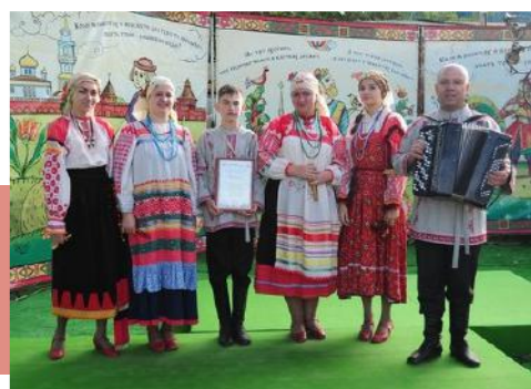
Фольклорный ансамбль «Спасская слобода»

из Новомосковска (руководитель А.В. Мельников). Они не только порадовали зрителей песнями, но и воодушевляли мастеров в творческих поединках, водили хороводы с детьми.