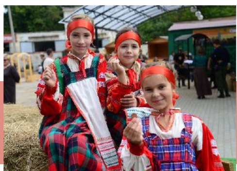
Монетка «Тульская кузня» на память

Первый региональный праздник посетило более 2000 человек, представители национальных объединений и землячеств, общественных организаций, школьники и студенты из Тулы и Тульской области, турагенты и туроператоры. Они с удовольствием участвовали в мастер-классе «Гвоздик», познакомились с кузнечным ремеслом, играли в народные забавы.