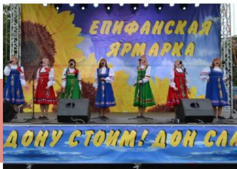
Выступление вокального коллектива «Лейся, песня!»