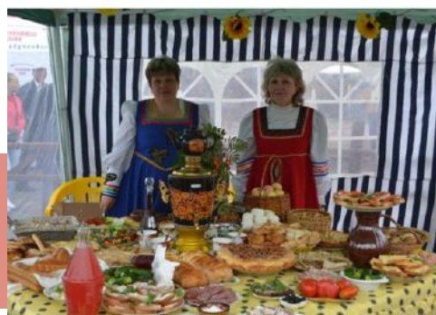
Угощения «Кимовского подворья»

Гости и участники Епифанской ярмарки могли полакомиться вкуснейшими пирогами, блинами с медом, различной выпечкой, которую приготовили работники МКУК «ПЦКиД».